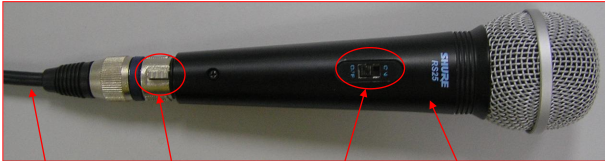
13. สายไมโครโฟน